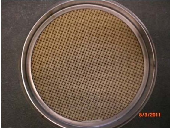
So sieht ein neuer Dieselpartikelfilter von innen aus.

Im Einzelnen kann man dies auf folgenden Bildern sehr gut erkennen: