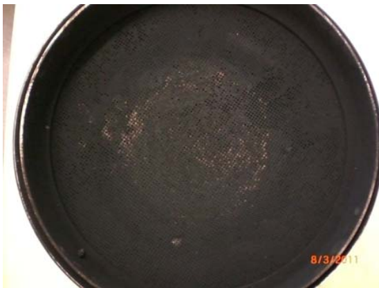
So sieht ein gebrauchter verstopfter Filter aus.