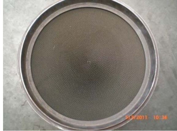
So sieht ein neuer KAT von innen aus