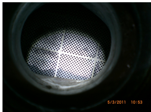
So sieht ein von uns gereinigter / regenerierter und wieder einsatzbereiter Filter aus.